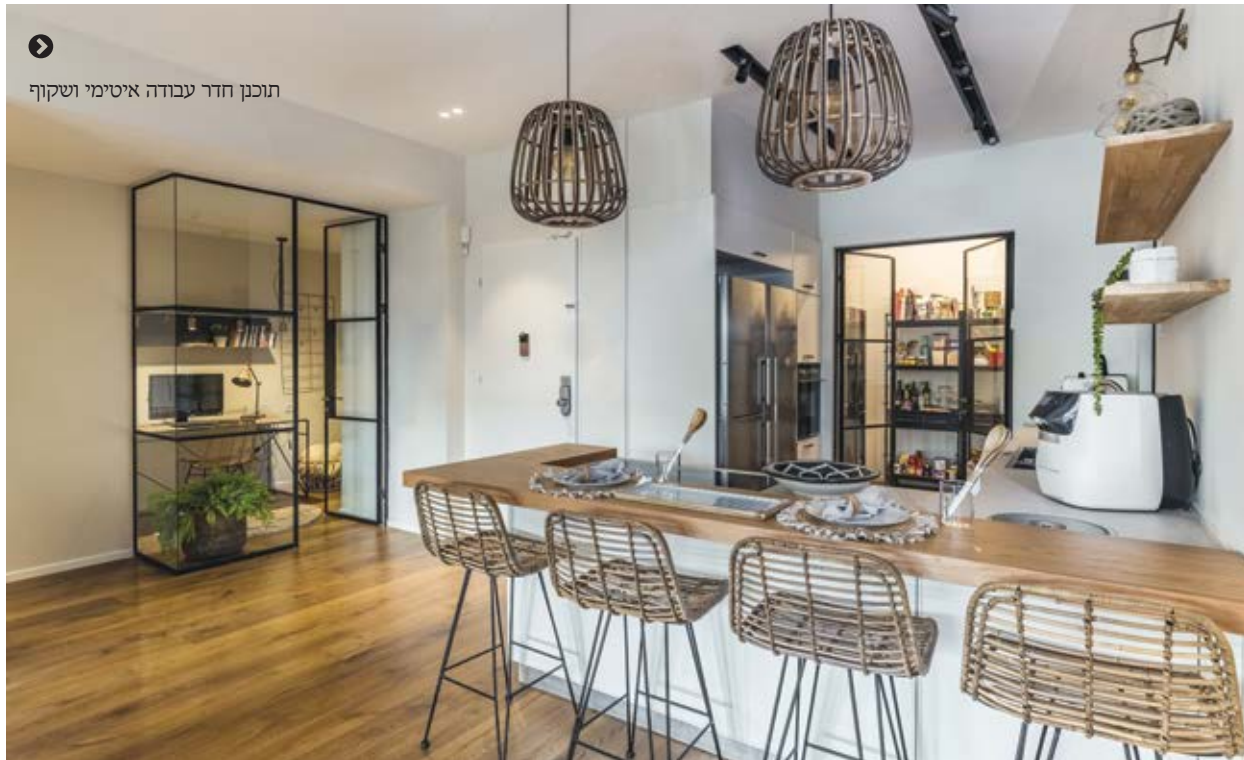
תוכן חדר עבודה איטימי ושקוף

חדר המגורים עוצב בהתאם למסר העיצוב הכללי של ניוחות ואוויריות: חיפוי פרקט חמים, עליו שטיח רך סיבים, ספה אפורה ולצדה כורסת עור והדום בגוון תואם. אל מול הספה קיר בריקים בהיר וספרייה ענקית שמתפרשת על כולו, עשויה מעץ המתכתב עם גוון העץ של הפרקט, ומחיבורי ברזל דקיקים. במרכז טלוויזיה תלויה, ומסביב פריטי דגש ושאר שכיות חמדה שאספה ורכשה עבורם המעצבת. בסוף החלל הפתוח נמצא דלפק אכילה גבוה במטבח, ולצדו כיסאות ראטן, שמוסיפים עוד נדבך טבעי ומחמם. המטבח נחשף במלוא הדרו מחדר המגורים, אך רק ברמז. הגישה אליו מתאפשרת בקלות מסביב, דרך מסדרון רחב. המטבח המינימליסטי מציג גישה מאווררת ולא מאיימת, במיוחד עבור